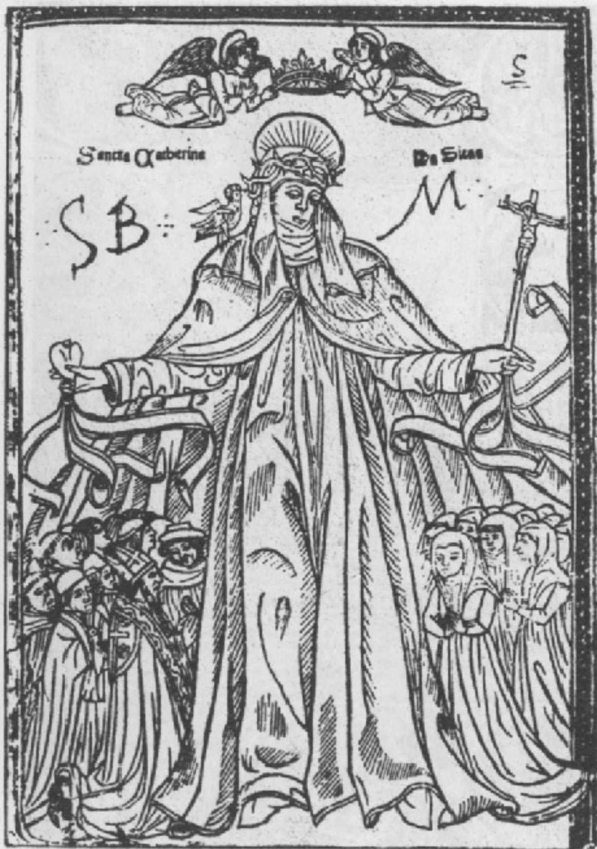
Santa Caterina da Siena, considerata così importante nell'Italia del suo tempo pressappoco come oggi vediamo la Madonna di Monte Berico