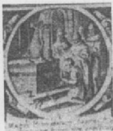
Il sepolcro di Bonaventura venerato dai confratelli

Ci siamo soffermati sul tema della “Commenda”, citando il libro “Padova Cristiana” di Guido Beltrame, pubblicato a Padova dalle Edizioni del Messaggero nel 1997, perché, se è vero, come troveremo fra poco, che Bonaventura fu ucciso per mano di un sicario armato dai signori di Padova, i Da Carrara, una delle cause fu l’azione del cardinale per risollevare gli ordini religiosi e quindi per combattere il cancro che li rodeva, che era proprio “Commenda”, storpiata nel modo che abbiamo visto.