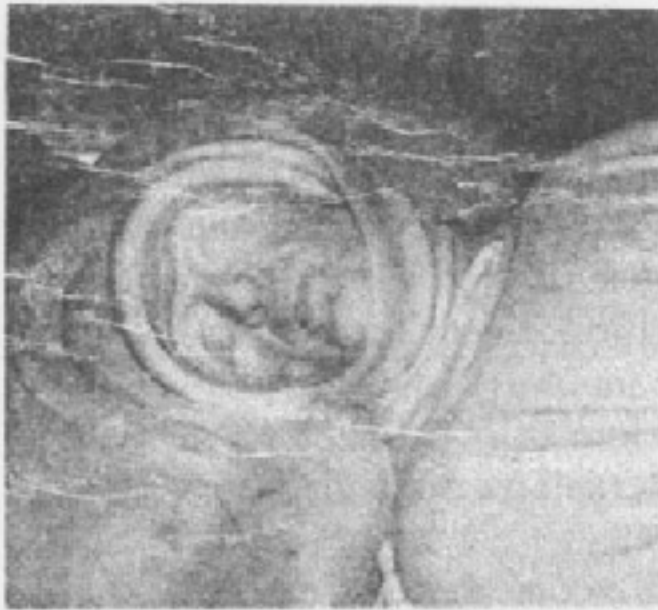
Ritratto di Jacopo II Da Carrara

pugnale di Guglielmo, un suo parente, figlio naturale di Jacopo I da Carrara detto "il grande". Jacopo II - scrive il Gazzettino - nonostante avesse dato la scalata al potere in