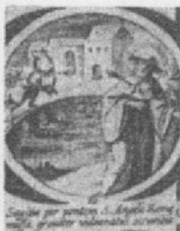
Bonaventura colpito da una freccia