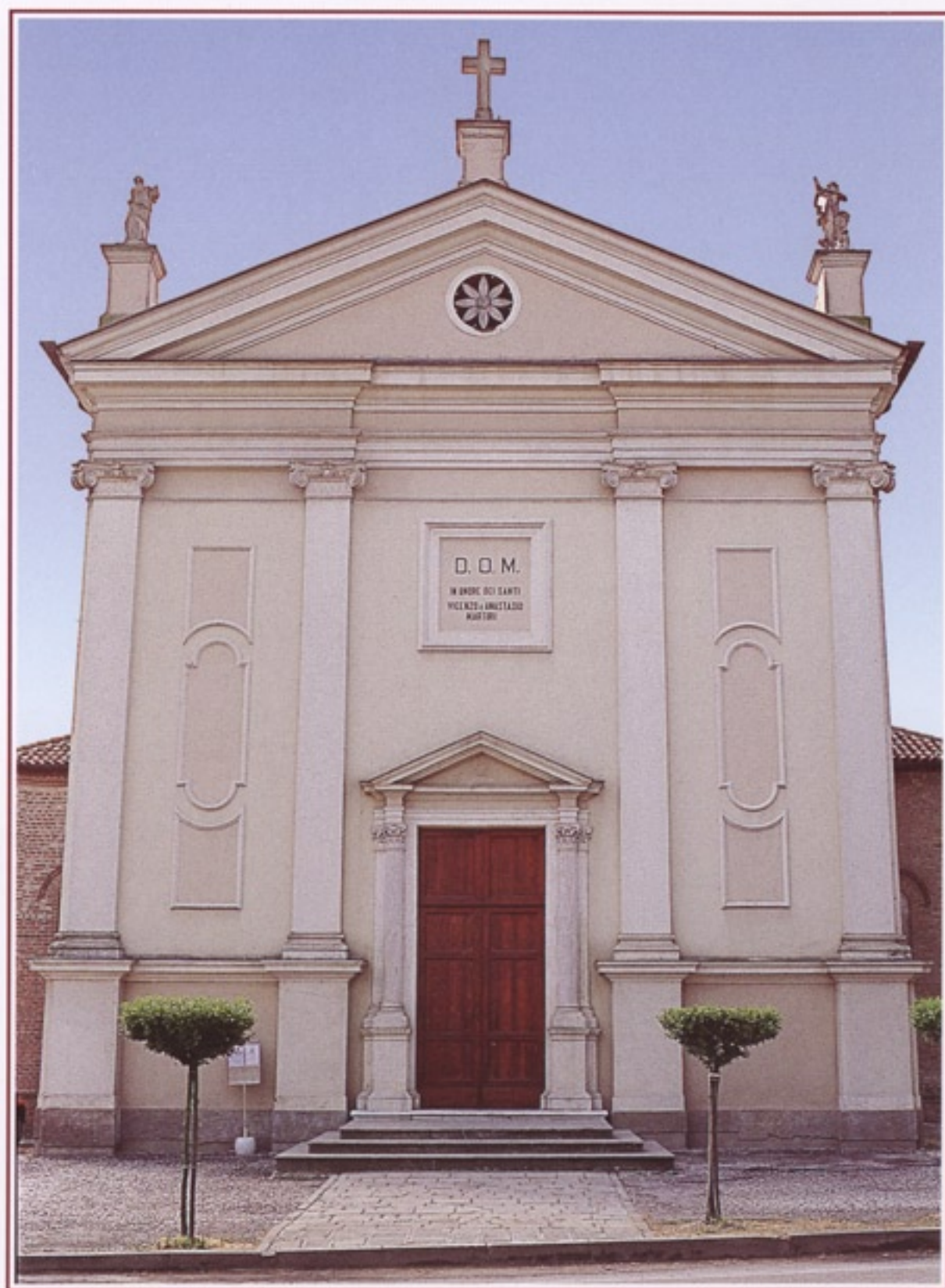
Chiesa parrocchiale di Peraga