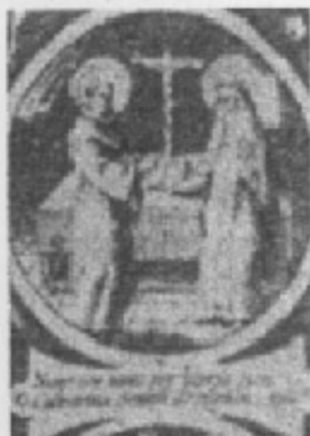
Bonaventura con Santa Caterina