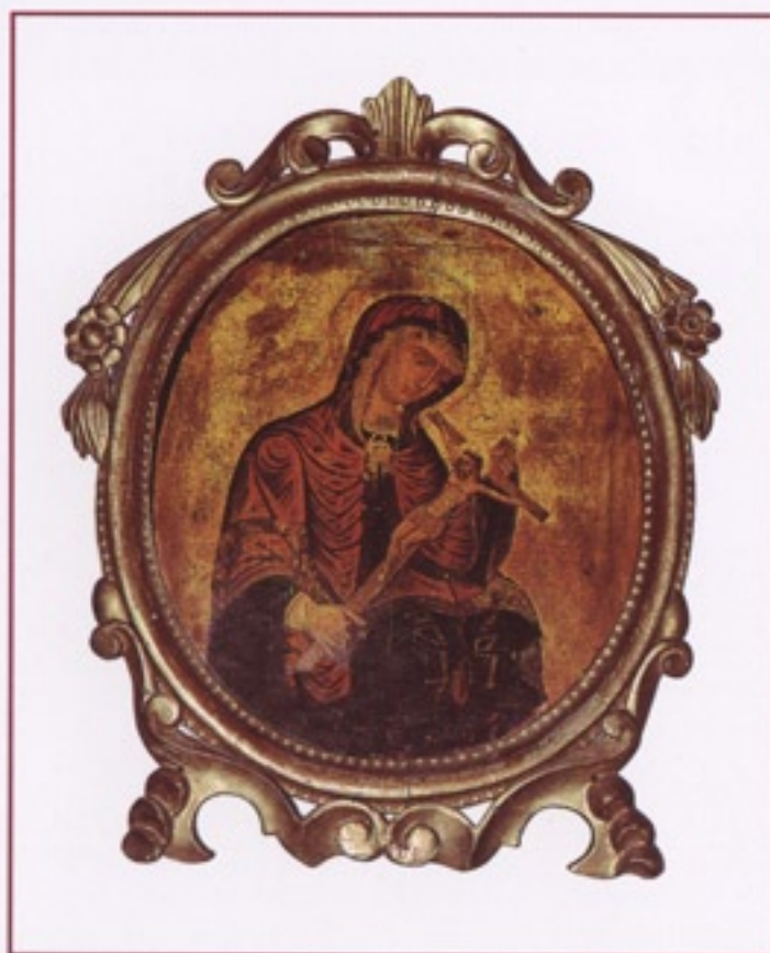
Madonna di Candia Chiesa parrocchiale di Peraga

Due opere che risalgono al tempo del Beato Bonaventura