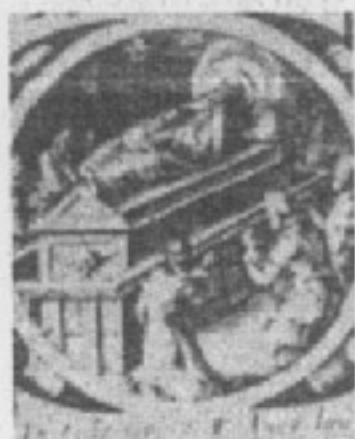
Monumento funebre di Bonaventura

Appena due giorni prima dell'elezione del suo competitore, il 18 settembre 1378, il Papa Urbano VI° eleggeva Bonaventura cardinale: aveva finalmente accolto le insistenze di santa Caterina che, oltre a raccomandargli di essere "dolce", gli aveva suggerito ripetutamente di trovare "una brigata di buoni cardinali" che collaborassero con lui nel governo della Chiesa che in quelle circostanze era diventato estremamente difficile. Non è sbagliato pensare che alcuni nomi dei nuovi cardinali siano stati suggeriti dalla stessa Caterina, tra i quali quello del nostro concittadino, visto che in quel periodo gli indirizza la lettera cui abbiamo già accennato, nella quale gli raccomanda di essere "colonna forte, ferma e stabile delle anime... e accrescimento della verità di Papa Urbano vero Sommo Pontefice". Eletto cardinale con il titolo di santa Cecilia, il primo del suo ordine ad essere elevato alla sacra porpora, Bonaventura continuò a governare l'ordine degli Agostiniani per mezzo di Vicari.